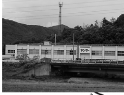
永原農村精密工場