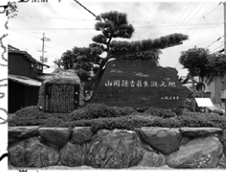
高月町山岡孫吉生誕地