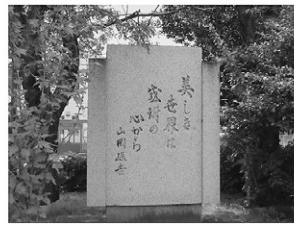
長浜市高月支所前