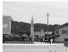
田園の中にひととき聳える生誕地東阿閉村公民館