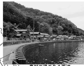
農村工場のある菅浦